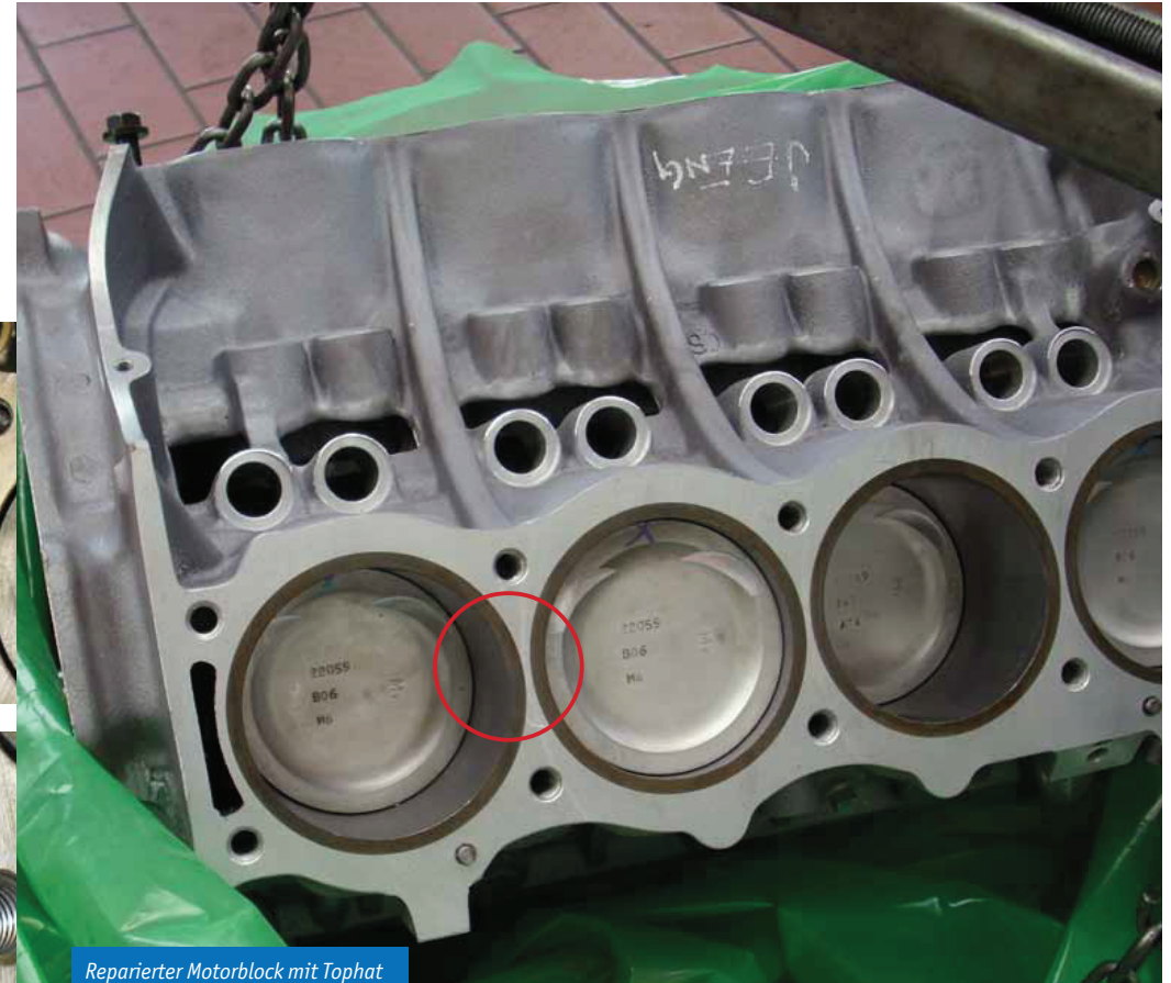
Reparierter Motorblock mit Tophat Liners. Besser als das Original