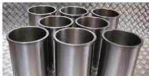
Tophat Liner. Man sieht deutlich die obere Kante an der Laufbuche

Das Zauberwort heißt: „Tophat Liner“. Das ist nichts anderes als eine Laufbuche mit einer oberen Kante. Hier kann die Buchse gar nicht mehr wandern und die Kopfdichtung dichtet den Brennraum zur Buchse komplett ab und liegt dabei nur auf dem Stahl der Buchse auf. Bei der ursprünglichen Bauweise dichtet die Kopfdichtung auf dem Aluminium ab und bei einer undichten Laufbuche können die Gase an der Buchse vorbei in den Kühlkreislauf drücken.